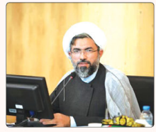
رئیس کمیسیون فرهنگی شورای شهر کرج

یکی از دیگر راهکارهای مهم برای تقویت روابط سازمانی، استفاده از خدمات مشاوره بازاریابی است. این بازاریابان می‌تواند به شما کمک کند تا با دیگران به راحتی ارتباط برقرار کنید و مشکلات را حل کنید.