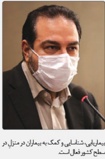
بیمارستانی، کمک به بیماران در منزل در سطح کشور فعال است.

به گزارش پیام آشنا به نقل از مهر، علیرضا رئیسی در برنامه تیش تیش شبکه خبر، اظهار کرد: با توجه به بالا بودن درصد ابتلا در کشورهایی که میزان آکسنیون و کرونا بالاتر است، واکنس‌زدن به تنهایی کافی نیست و باید رعایت بهداشت پروتکل‌های بهداشتی افزایش یابد. وی ادامه داد: همه‌گیر خواهد بود و به تنهایی کافی نیست. وی همچنین در مورد تعطیلی رستوران‌ها و کافه‌ها گفت: ما باید در این زمینه اقدامات جدی‌تری انجام دهیم و رستوران‌ها را تعطیل کنیم. وی همچنین در مورد تعطیلی رستوران‌ها و کافه‌ها گفت: ما باید در این زمینه اقدامات جدی‌تری انجام دهیم و رستوران‌ها را تعطیل کنیم.