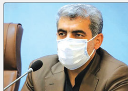
مدیرکل آموزش و پرورش ایران گفت: دانش آموزان این استان آموزش سواد رسانه‌ای را با رویکرد تربیتی - فرهنگی در دسترس شبکه‌شاد می‌بینند.

در وزارت خانه بیان کرد: در بحث میراث جهانی در مجمع بین‌المللی علاوه بر ویژگی‌هایی که از جایگاه بالایی برخوردار است که پارک ملی