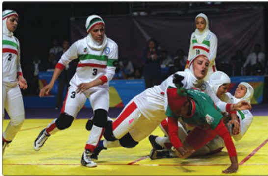
ماتندنبال کتیدلهستان، چین تاییه و هندداشتیم و در نهایت از رسیمن به فیثال بازمندیم و به عنوان سومین مشترک‌رضایت دادیم.

تیم به میزبانی هند برگزار شود و تاریخ مسابقات خرداد ۱۴۰۴ بود اما به دلایلی مسابقات به تعویق افتاد و مقرر شد مرداد برگزار شود. سپس نه تنها تاریخ مسابقات به این موکول شد بلکه میزبان نیز از هند به بنگلادش تغییر کرد. زمانی که قرعه‌کشی و وزن‌کشی انجام شد مشخص هم شد که تنها ۱۲ تیم برای مسابقات اعلام آمادگی کردند. ترتیب‌دهنده اعلام داد: در نهایت تیم‌ها در دو گروه به رقابت پرداختند. در گروه A هند سرگروه شد و در گروه B ایران قرار گرفت که از شانس بد ما تمام تیم‌های حاضر در بازی‌های آسیایی هلانگزو نیز در همین گروه بودند. ما بازی‌های سختی با تیم‌هایی