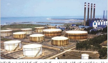
در طول سه ماه گذشته در کشور افزایش یافت. سوخت به نیر و گاه‌ها افزایش یافت.