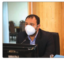
معاون فنی و عمرانی شهرداری تهران، روزهای چهارشنبه در بازدید از پروژه احداث پل تقاطع غیرمسطح خیابان شهید سلیمی با کانال سیل برگردان غرب، در منطقه ۵ راه‌آهن، حضور یافت.