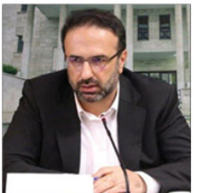
رئیس کل دادگستری استان البرز با اعلام اجراء عملیات مقابله با تغییر کاربری اراضی زراعی در یک روز، گفت: در این اقدام ۱۰۰۰ هکتار زراعی در حال تغییر کاربری شد.

بروز کورنگلام خوشرو شاهی Alborz.payam@gmail.com