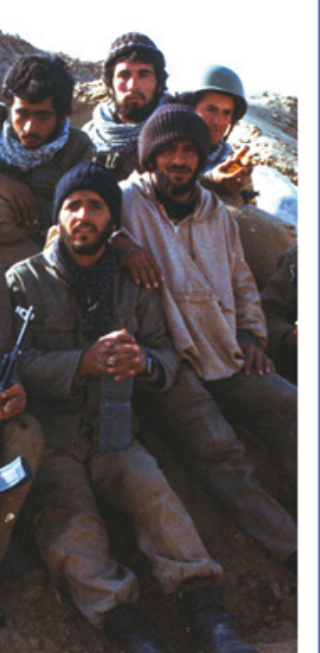
بیانات رهبر انقلاب در دیدار دست اندرکاران کنگره شهدای استان البرز | ۱۴۰۴/۹/۲۴

اشاره رهبر به مسئله «مقابله با دشمن» به عنوان یکی از انگیزه های شهنا شهدا در مقابل دشمنان میراث های ماندگار کشور ایستادگی کردند مسئله ای «حسن مقابله با دشمن»؛ این احساس مهمی است، وقتی که جوان به درک و شعور جوانی خودش میرسد. در آن حده که از نوجوانی و از بچگی خارج میشود. احساس میکند که یک تکلیفی در قبال کشور دارد که باید آن را انجام بدهد، و کسانی هستند مترصدند که خانه ای او را، کشور او را، و داشته های فرهنگی و مدنی و میراث های ماندگار او را از او بستانند؛ در مقابل اینها می خواهد بایستد؛ این یک حسی است در انسان؛ و از این قبیل.