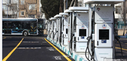
تأسیسات شارژ خودروهای برقی در شهر کرج.

رئیس کمیسیون عمران و حمل و نقل شورای اسلامی شهر تهران، باز خوردهای برقی شخصی ۶ هزار و ۵۵۵ ریل به ازای هر کیلووات ساعت برای شارژ DC و ۶ هزار و ۶۸۹ ریل به ازای هر کیلووات برای شارژ AC در نظر گرفته شده که تفرقه وزارت نیرو نیز به آن اضافه می‌شود. از آلیوس‌های برقی هیچ وجهی جهت شارژ اخذ نخواهد شد.