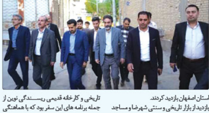
مدیر عامل شرکت باز آفرینی شهری ایران در حال بازدید از بافت‌های تاریخی و ناکار آمد شهرضا.