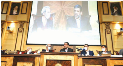
گردشگری بیماری است که نیاز به شوک دارد و اگر درمان شود کشور نجات می‌دهد. گردشگری و صنایع دستی، گفت: گردشگری بیماری است که نیاز به شوک دارد و اگر درمان شود کشور نجات می‌دهد.

وزیر میراثفرهنگی، گردشگری و صنایع دستی، گفت: گردشگری بیماری است که نیاز به شوک دارد و اگر درمان شود کشور نجات می‌دهد. گردشگری و صنایع دستی، گفت: گردشگری بیماری است که نیاز به شوک دارد و اگر درمان شود کشور نجات می‌دهد. گردشگری و صنایع دستی، گفت: گردشگری بیماری است که نیاز به شوک دارد و اگر درمان شود کشور نجات می‌دهد.