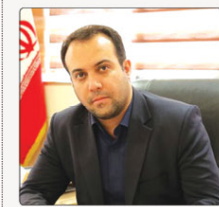
مدیر منطقه ۸ شهرداری کرج گفت: این امر می‌تواند شهرداری را در اجرای امورهای جاری و خدمات به شهروندان یاری کند.