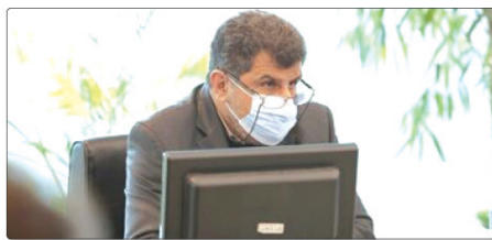
رئیس کمیسیون سازمانی راهبردی و امور مشارکتهای شورای شهر پیشنهاد داد شهرداری کرج یک پژوهشکده دائمی راه‌اندازی کند.

وی گفت: شهردار محترم تقاضا دارد که هر چه سریع‌تر نسبت به تسریع در روند تکمیل و بهره‌برداری پروژه ادامه دهید تا بتوانیم عملیات اجرایی را آغاز کنیم.