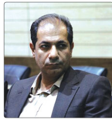
رئیس سازمان سیما، منظر و فضای سبز شهری شهرداری کرج گفت: عملیات کاشت درخت در ۲۰۰ هکتار از اراضی حلقه درخت در حال انجام است.

۱- چرا اطلاعاتی دربارت این شغل با شرکت ما نداریم؟ ۲- آیا حتماً قبل از حوزه استخدام کار کرده‌ام؟ ۳- بزرگ‌ترین شکست تا حالا چه بوده؟ ۴- از بین این همه متقاضی، بااستعدادم چرا باید تو را انتخاب کنیم؟ ۵- اگر از آخرین ریاست سول کنیم، چه چیزی دربارت می‌گویند؟ ۶- پنج سال آینده خودتان را کجا می‌بینی؟ ۷- بزرگ‌ترین شکست تا حالا چه بوده؟ ۸- از بین این همه متقاضی، بااستعدادم چرا باید تو را انتخاب کنیم؟ ۹- اگر از آخرین ریاست سول کنیم، چه چیزی دربارت می‌گویند؟ ۱۰- پنج سال آینده خودتان را کجا می‌بینی؟