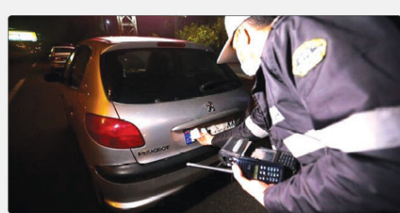
رئیس پلیس راهنمایی و رانندگی البرز با اینک بیان کرد که پلیس کتبی که برای فرار از اعمال قانون نیست به صورت کتبی گردن پلاک خود قلم می‌کند. برخورد قانونی می‌کند. توضیح داد: از ابتدای این طرح تاکنون ۲۲۳ خودرو با پلاک مخدوش و ۴۸۴ خودرو بدون پلاک اعمال قانون شدند.