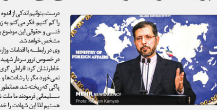
سردار سلیمانی وزیر امور خارجه ایران گفت: آمریکا در پرونده تور سردار سلیمانی بی کفایتی مانده و هنوز نتوانسته است اقدامات لازم را برای آزادی سردار سلیمانی انجام دهد.

تقویت زیرساخت‌های ملی- چه این فناوری موفق شود و چه نشود، نیاز به زیرساخت‌هایی دارد. دولت حق ندارد از بودجه عمومی زیرساخت‌های یک فناوری پرریسک (استخراج رمزارز) را به صورت مستقیم با غیرمسئول سرمایه‌گذاری کند، اما اگر سرمایه‌گذاری می‌کنند نمی‌توانند رشد کنند.