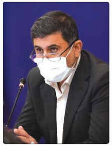
نماینده‌های دولت لرستان البرز گفت‌واری کردند که در استان البرز طبق اظهارات سخنگوی ستاد ملی مقابله با کرونا اظهارات خوبی صورت گرفته و این استان در میزان مبتلایان، بستری‌ها و تلفات ناشی از کرونا با کاهش چشمگیری مواجه شده است.