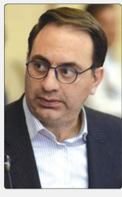
رئیس سازمان صنعت، معدن و تجارت استان البرز

به گزارش پیام آشنا به نقل از مهر، مرکز بانک خلعو، سخنگوی ستاد بودجه ۱۴۰۰ در پاسخ به سؤالی مبنی بر اینکه چرا در تیرماه ۱۴ درصد بودجه به سازمان هدفمندی یارانه ها از محل انتشار لایحه در صورت کسب منابع داده شده است، گفت: در شش ماهه اول سال به دلیل کاهش درآمد فرآورده های صادراتی، کاهش مصرف بنزین خانگی در ماههای ابتدای سال به دلیل کرونا و به تبع آن کاهش سفرهای داخلی از منابع هدفمندی محقق نشده که با توجه به شرایط اقتصادی و متغیر اقلیم، انتشار آن تا آخر در پرداخت های یارانه اجتناب ناپذیر نیست. به نقل از لایحه مالی اصلاحی اقلیم شده است. خلعو با بیان اینکه حدود ۳۵ درصد از منابع هدفمندی یارانه ها تا ۸ ماهه اول سال جاری محقق نشده، خاطر نشان کرد: برای سال آینده برای سازمان هدفمندی یارانه ها گفته شده است که در صورت کسب منابع خلعو خود آن شرکت لایحه را با تضمین خوش متصرف کند.