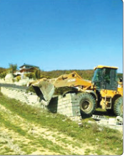
مستردامه خواهد داشت.

فرمانده یگان حفاظت از اراضی کشاورزی استان البرز اعلام کرد: مقرر شد ۳۷ هکتار از اراضی کشاورزی چهارباغ البرز آزادسازی شود. این اقدام در راستای احیای زمین های کشاورزی و توسعه تولیدات داخلی انجام شده است. فرمانده یگان حفاظت از اراضی کشاورزی استان البرز گفت: این اقدام در راستای احیای زمین های کشاورزی و توسعه تولیدات داخلی انجام شده است.