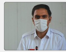
معاون برنامه ریزی و توسعه سرمایه انسانی شهرداری کرج گفت: پایان سال بود نزدیک ۲۲ کارکن شهرداری در هفته سوم آذر ماه را اعلام کرد.

لیکن این آخرین شبکه اجتماعی نبود که امکان استوری را در اختیار کاربران قرار داد. بعد از اقبال کاربران اینستاگرام به استوری این امکان با استقبال کاربران فیس بوک و اینستاگرام روبه رو شد. در ابتدا کاربران محتوایی را در استوری منتشر می کردند که به نظرشان ارزش پست شدن نداشت. اما رفته رفته استوری جای خود را در میان کاربران باز کرد و کار به جایی رسید که پلتفرم های دیگری مانند پینترست، واتساپ و موزایک هم تویتر امکان استوری را با عنوان «Fleets» در دسترس کاربران قرار دادند. در ادامه در این یادداشت قصد داریم به این موضوع بپردازیم که چرا تویتر در دنیای امروز مهم است و برنده چگونه می تواند از امکان استوری در تویتر در دوران کووید-۱۹ استفاده کند.