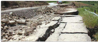
شهرستان طالقان شناسایی شده که چهار نقطه آن در جاهای اصلی قرار گرفته است