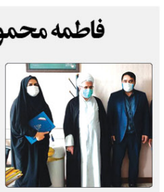
بیماران مبتلا به کووید-۱۹ در بیمارستان‌ها