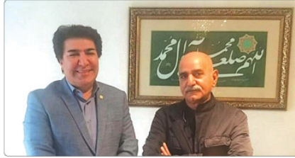
ریاست جمع خیرین مدرسه‌سازان استان البرز از اسیرین وارد: دربار: عنوان کرد: البرز در زمینه سرانه فضای آموزشی وضعیت نامناسبی دارد.