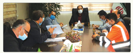
سرپرست فرمانداری شهرستان نظرآباد ضمن میزبانی از مدیرکل راهانداری و حمل و نقل جاده‌ای استان البرز به بیان پلاطی از مشکلات جاده‌ای شهرستان پرداخت.

قزوین و ایجاد پل هوایی آن، تأمین روشنایی محور بانگ (شمال زیرگذر)، بهسازی و ایمن سازی جاده تکمیل سبهر و محورهای احمدآباد و نجم‌آباد نصب تابلوهای اطلاع رسانی در معابر و جاده‌ها و از جمله اصلی ترین تدبیراتی که شهردار نظرآباد است که در تیارهای عمرانی شهرستان نظرآباد است که در دستور کار قرار دارد.