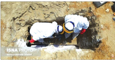
رئیس دانشگاه علوم پزشکی البرز گفت: متأسفانه در ۲۴ ساعت گذشته ۲۱ بیمار کووید-۱۹ جان خود را از دست داده است و مجموع جان باختگان این بیماری به ۲۰ هزار و ۵۸۲ نفر رسید.

کنون ۵۴۴ هزار و ۶۲۲ نفر از بیماران، بهبود یافته و از بیمارستانها ترخیص شده‌اند. به گفته وی، ۵۳۰ نفر از بیماران مبتلا به کووید-۱۹ در وضعیت شدید این بیماری تحت