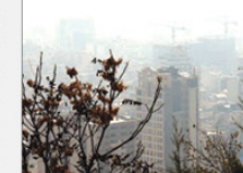
آخرین اطلاعات منتشر شده از سهم ملغی آلاینده

در آلودگی هوای تهران بیگران آن است که در میان متعلق متحرک کلمینها و سایر منابع ملغی ثابت و متعلق تیروکله ها نقش پررنگی در آلودگی هوای تهران دارد.