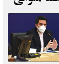
سخنگوی وزارت بهداشت