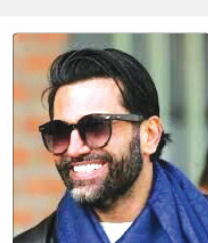
تیم فوتبال گل ریحان امیرز فضل پیش رو با رای...

به گزارش پیام آفتاب به نقل از ایرنا، محمود سلطانی‌فر روز یکشنبه در این امضا تهاجمه تورسم ورزشی بین وزارتخانه‌های ورزش و جوانان و گردشگری و همچنین میراث فرهنگی، گردشگری و صنایع دستی افزود: پیش از قبل در چنین ایامی در زمان وزارت محمود گسوزی «فهرنامه‌های در این زمینه بین ۲ وزارتخانه به امضا رسید و امروز با امضاء متوجه این فهرنامه را امضا می‌کنیم. وزارت ورزش و جوانان و وزارت گردشگری به اجراء خوبی برای تعامل بهتر رسیده و شراف خوبی بر این نوع همکاری دارند. وی گفت: گردشگری ورزشی در دنیا به عنوان یک صنعت درآمدزا بسیار مورد توجه است و ما نیز با استفاده از این بستر می‌توانیم با بهره‌گیری از رقی که گردشگری ورزشی به خود اختصاص می‌دهد به درآمدزایی ارزی کشور و فرایند توسعه کمک کنیم. سلطانی‌فر افزود: باید دلد با تلاش بسیار و در دولت‌های مختلف زیرساخت مناسب برای میزبانی از دیدگاه‌های مهم بین‌المللی ورزشی فراهم شود. دست ورزش‌ها و بازی‌های بومی محلی مورد اقبال گردشگران خارجی است و