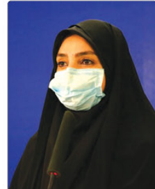
سخنگوی وزارت بھداشت از شناسایی ۲۸۹۰ مورد جدید کووید-۱۹ در کشور طی ۲۴ ساعت گذشتہ

از ابتدای شیوع کرونا تا کنون ۱۵ ہزار و ۸۲۴ ماموریت توسط نیروہای امدادی اورژانس البرز برای خدمت رسانی بہ این دستہ از بیماران انجام شدت.