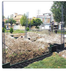
ایجاد قرالت خانه در مناطق کم برخوردار نقش به‌سزایی در ارتقای سطح فرهنگی ساکنان این محلات دارد.