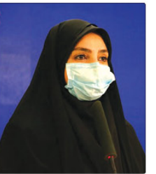
در شرایط هشدار بیماریی گفت: استانی در استان، هر زمان فراس و گلستان نیز در وضعیت هشدار قرار دارند