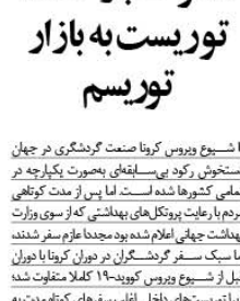
محرک‌ک بازگشت توریست به بازار توریسم

فرهنگی در این زمینه به نظر می‌رسد که در ایران به شدت رواج یافته است. اما با توجه به کمبود امکانات و خدمات، این نوع تفریح برای بسیاری از مردم امکان‌پذیر نیست. شهرداری باید در این زمینه اقدامات بیشتری انجام دهد تا بتواند نیازهای مردم را برطرف کند.