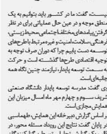
ساختن‌های بلندمرتبه در کوچه شش‌متری!