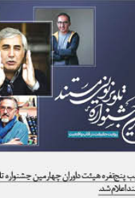
تکریم پیچنده هیئت داوران چهارمین جشنواره تلویزیونی مستند اعلام شد

به گزارش پیام آشنا به نقل از مهر، مهرداد رنجبر-نمایشنامه‌نویس، بازیگر و کارگردان «گوارا» پروژه بزرگی است. نمایش در تاریخ ۱۰ شهریور ۱۳۹۹ در تهران اجرا خواهد شد.