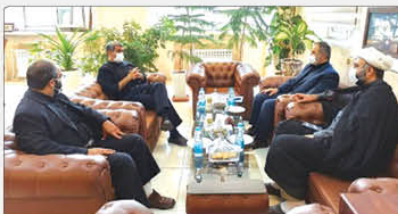
جلسه با اشاره به اینکه با توجه به نامناسب بودن نماز در کلاس‌های مجازی

ایجاد تهاجمی‌ها در جامعه می‌شود اضافه کرد نماز نیز با هدف ترویج این فریضه الهی در جامعه است که باید تلاش کنیم تا دانش‌آموزان از نماز شناخت پیدا کنند.