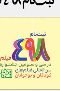
ثبت نام فیلم در سی و سومین جشنواره بین‌المللی فیلمهای کودکان و نوجوانان