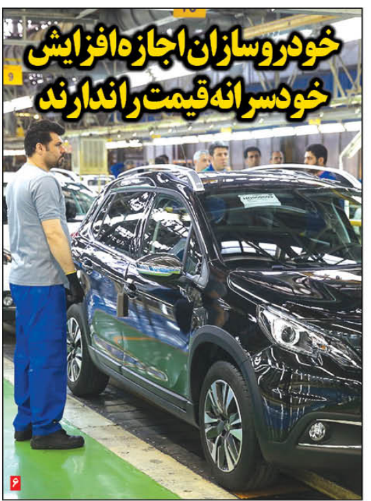
خودروسازان اجازه افزایش خودسرانه قیمت را ندارند