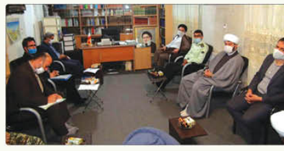
امام جمعه طالقان گفت مساجدی که مراسم برگزار می کنند، موظفند اجرای پروتکل بهداشتی هستند. فرغی انصورت اجازه برگزاری مراسم به گزارش پیام آستانه، نحوه برگزاری مراسم