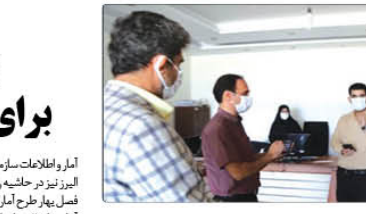
به گزارش پیام آشنا، عربشاهی با بیان اینکه این طرح به صورت فوری به اجرا در می آید...