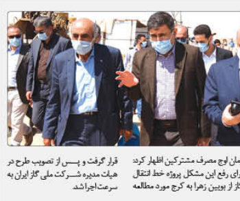
قرار گرفت و پس از تصویب طرح در هیات مدیره شرکت ملی گاز ایران به سرعت اجرا شد.

هشدر گفت: همچنین استنهای فارس، ایلام، لرستان، هرمزگان، زنجان، قزوین، آذربایجان غربی، بوشهر، چهارمحال بختیاری و کهگیلویه و بویر احمد هم در وضعیت هشدار قرار دارند. لاری برای در کشورمان باخوردن نوع رفتار ما طی هفته های گذشته استند امپدوریم با تقویت و تدویم عزم و زاده خود در رعایت پروتکل ها و بویژه سه اصل شست و شوی مدام دست ها، رعایت فاصله گذاری اجتماعی و استفاده از ماسک شادمانی و شکر تجزیه انتقال بیماری در کشور رو همچنین درباره استنهای در وضعیت بشیم