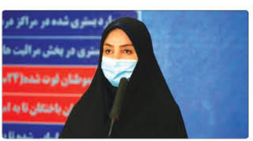
سخنگوی وزارت بهداشت گفت: خوشبختانه تا کنون ۲۹۹ هزار و ۱۵۷ نفر از بیماران، بهبود یافته و با یا بیمارستانی و در منزل خود...

سخنگوی وزارت بهداشت از شناسایی ۲۴۴۷ مورد جدید کرونا در کشور طی ۲۲ ساعت گذشته خبر داد. به گزارش پیام آشنا، دکتر سیمالداد لاری گفت طی ۲۴ ساعت گذشته منتهی به ۲۷ مرداد ۱۳۹۹ و هر روز و ۲۴۲ بیمار جدید مبتلا به کوویده ۱۹ در کشور شناسایی شد که یک هزار و ۲۵۵ نفر از آنها بستری شدند.