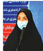
رئیس دانشگاه علوم پزشکی استان البرز اعلام کرد که طی ۲۴ ساعت گذشته منتهی به ۲۶ مرگ در استان البرز گزارش شده است.