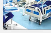
معاون درمان وزارت بهداشت از اختصاص ۴۰ تخت آی.سی.یو به استان البرز خبر داد.