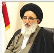
نماینده ولی فقیه در استان ایلام گفت: مشکلات ملای و معنوی شهر و استان را در اختیار کلدیها...