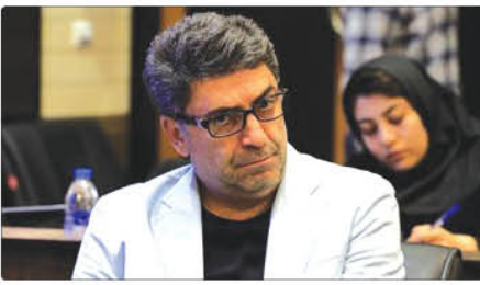
یگانگی با بیان اینکه نصب بدون شایعه و بدون مجوز تابلوهای تبلیغاتی از عوامل دخیل در بیروز آشفته‌گی در نما و منظر شهری است.