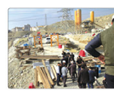
علی اسفند کمالی راننده شهردار کرج وعده داد که سال ۹۹ مالی است که در آن شاهد افتتاح بسیاری از پروژه های نیمه تمام خواهیم بود