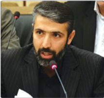
افزایش قیمت بنزین به تعزیرات احضار شد

معاون وزیر کار و رئیس سازمان فنی و حرفه‌ای کشور اعلام کرد: استقرار البرز بر پایه دلیلی معنوی بودن و مجرب و با تجربه تهران، به عنوان پایلوت استقرار بر پایه مهارت محوری به ترتیب برگزیده شد. به گزارش پیام آفتاب، علی‌اسط هاشمی در جمع فعالان بخش دولتی و غیردولتی مرتبط با فنی و حرفه‌ای استان البرز افزود: البته در این مسیر یک استستاره در متعلق توسعه یافته که پایه مهارت ضعیف و ترخ بیکارگی بالا است وجود دارد.