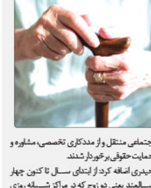
اجتماعی منتقل و از مددکاری تخصصی، مشاوره و حمایت حقوقی برخوردار شدند.

تولمنستاری سالمندان برنامه یز صورت بگیرد، افزود: باید شرایطی فراهم شود که سالمندان بتوانند با تسلط بر زندگی فردی و اجتماعی، سال های باقی مانده از عمر خود را با امید و انگیزه سپری کنند. وی با بیان اینکه بهداشتی آبریز خدمات خاصی به سالمندان تحت پوشش خود ارائه می دهند تا در مسیر تولمنستاری آنها گام بردارند، توضیح داد: بعد از معرفی سالمندان به مراکز آموزشی و تفریحی، برنامه یز در جشنوارن در کارگاه آموزشی آموزشی مربوط به خدمات و شناختی به منظور ارتقاء سلامت رفقی و اجتماعی آنها انجام می شود. این مسئول گفت: برگزاری اردوهای تفریحی و زیارتی به صورت گروهی از دیگر برنامه های روزی برای سالمندان است که اجازه نمی دهد آنان از بافت جامعه فاصله گرفته و منزوی شوند. وی اظهار کرد: در کارگاه آموزشی آموزشی آبریز برای مدیرکل بهزیستی البرز آمده بود: در حال حاضر بیش از ۲۵۰۰ سالمند در استان از خدمات روزانه و باشگاه روزی بهزیستی استفاده می کنند. وی با اشاره به فعالیت مراکز قوت های اجتماعی برای خدمات رسانی به سالمندان آرزیده گفت: تا پایان آبان ماه ۵۰ مورد سالمند آزاری در استان گزارش شده که این آبریز به مراکز قوت های