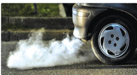
خودروهای آلاینده و فاقد معاینه فنی در همه فصل سال اجرا می شود. ماه دوم سال به دلیل

آلودگی بیشتر در کلاشهر ها، این طرح تشدید می یابد. رئیس پلیس راهنمایی و رانندگی البرز گفت: پلیس راهور همگام با دستگاه های مربوطه برای کاهش آلودگی ترافی می کند و نقش مردم نیز در این زمینه بسیار تأثیر گذار است.