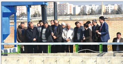
دهه مبارک به صورت رسمی فعالیت خود را آغاز می کند. در این مرحله روزانه

۷۰۰ مترمکعب از فاضلاب شهرک صنعتی هشگرد تصفیه و مورد استفاده در بخش اراضی کشاورزی شهرستان ساوجبلاغ قرار خواهد گرفت.