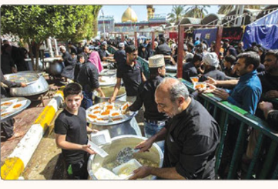
سازمان آموزشی علمی و فرهنگی مال متحد مهمان‌داری و ارائه خدمات در خلال زیارت میهنی امام حسین (ع) را به عنوان میراث معنوی بشری ثبت کرد.

هزاران موکب در طول بیش از ۲۰ روز در راه پیاده روی اربعین امام حسین (علیه السلام) در مسیر نجف به کربلا و میلیون‌ها زائر پذیرایی می‌کنند. خدماتی از قبیل تهیه غذا و جاسی خوب تا ناهای مختلف دیگر و منحصر به فرد نمونه بی نظیر جقه‌ای را خلق می‌کنند.