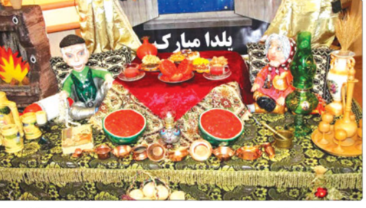
معاون آموزشی و فرهنگی اداره کل آموزش البرز گفت: جشنواره باستانی یلدا در مدارس و کانون‌های فرهنگی تربیتی این استان با ویکیو دانش آفرینی به اجرا در آمد.

یک گروه‌های خانوادگی برای دانش آموزان مورد بازدیدگری قرار می‌گیرد. معاون آموزشی و فرهنگی اداره کل آموزش و پرورش البرز با اشاره به اینکه در شب یلدا خوشنویسان نزدیک در خانه بزرگ خنجره گرد هم می‌آیند تا این جشن کهن ایرانی را پاس بدارند و در سرمای آفرین زمستان شبنم به یاد مغانی از اسپریری کنند. خاطرنشان کرد دانش آموزان در این جشن با چرای خورن اجیل مخصوص، هندوه‌ها، آله و شیرینی و میوه‌های گوناگون که همه جنبه نمادین دارند و نشانه برکت، ندرت‌نسی، فراوانی و شادکامی هستند نیز شناخت پیدا می‌کنند.