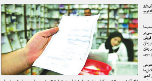
رئیس سازمان غذا و دارو با تأکید بر ممنوعیت فروش دارو به صورت اینترنتی، درباره برخی از داروهای خاص که در منزل بیماران ارائه می شود، توضیح داد.

به گزارش پیام آشنا به نقل از ایسنا، دکتر محمدرضا شمس‌الذحر درباره اقدام برخی شرکت‌های پخش مبنی بر فروش آنلاین دارو گفت: در دنیا هم هنوز اجازه فروش اینترنتی دارو داده نشده است زیرا مصلحتی در زمان معاینه پزشک بیمار باید حضور داشته باشد. در زمان تحویل دارو هم حتماً باید یکسری اطلاعات از سوی پزشک دربار بیمار دریافت شود. وی با بیان اینکه البته در دنیا مجوز فروش اینترنتی برخی اقلام مانند کالاهای آرایشی-بهداشتی، مکمل‌ها و برخی اقلام OTC داده شده است، افزود: در کشور ما نیز در گذشته مجوزهایی برای فروش اینترنتی برخی اقلام آرایشی-بهداشتی و مکمل‌ها داده شده است. اما فروش اینترنتی دارو همچنان ممنوع است و در این باره خود