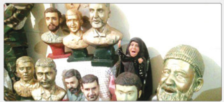
هنرمند البرزی با حمایت کمیته امداد (مهر) و توسعه کار مجسمه‌سازی، ۱۶ هنرجو شغل ایجاد کرده است.

به گزارش پیام آفتاب، استاد مجسمه‌ساز البرزی با اشاره به اینکه در سال ۱۳۷۶ در قالب دریافت تسهیلات انتقال از حمایت کمیته امداد برخوردار شده است گفت: من متولد ۱۳۴۵ هستم و وقتی ۸ ساله بودم و دوران دانش‌آموزی را می‌گذرانیدم، اوقات فراغت خود را با گل بازی سپری می‌کردم.