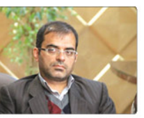
داستان عمومی و انقلاب شهرستان فریدیسی از وی و برگزاری مراسم فریدیسی را توهین به سرور و سالار شهیدان خوانده و بیان کرده است.