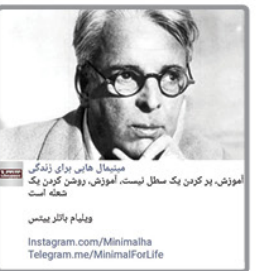
منیسمال هاب برای زندگی

منیسمال هاب برای زندگی آموزش بر کربن بد عمل نیست. آموزش روشن کردن یک خانه است.