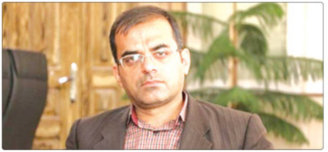
نظارت و بررسی فرار دلد، افزود: حسب گزارش سازمان با بیان اینکه مسائل و شرایط شهراست فردیس تحت

دانشان عمومی و انقلاب شهراست فردیس از پرداخت غیرقانونی ۲۵۰ میلیون تومان پول توسط شهرداری به شورای شهر کرد.