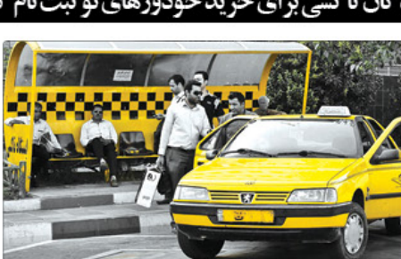
رئیس سازمان حمل و نقل بار و مسافر شهرداری کرج گفت: رانندگان تاکسی می‌توانند با مراجعه به سایت سامانه خرید خودرو برای دریافت تاکسی نو ثبت نام کنند.