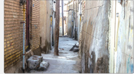
این منطقه قرار گیرد. وی همچنین خواستار انجام اقدامات لازم به منظور تسریع در اجرای پروژه بااول