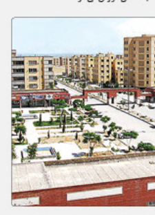
این تصویر، یک نمای کلی از یک مجتمع مسکونی مدرن را نشان می‌دهد که شامل چندین برج آپارتمانی و فضای سبز است.