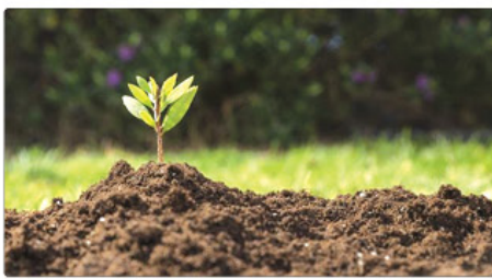
هستند و در ادامه به نشانه‌های نظم اشاره شده است. در این تصویر، یک گیاه کوچک سبز از دل خاک تیره و حاصلخیز جوانه زده است.

قانون انتقال خاک به خارج از کشور ممنوع است و فقط خروج مواد معدنی و مخدات کم خاک به منظور امور