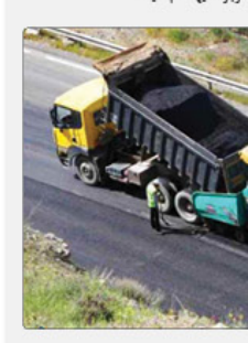
این تصویر، یک نمای کلی از یک سایت ساختمانی در حال توسعه را نشان می‌دهد.